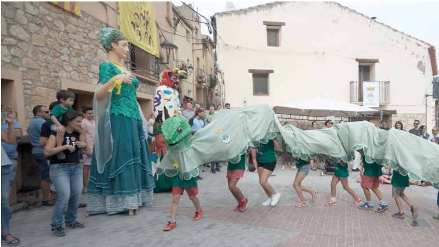
La Serpeta, primer element del bestiar popular del poble, durant la seva estrena amb la canalla l'agost del 2018.