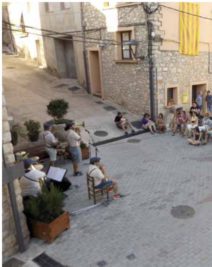
Stromboli Jazz Band durant la seva actuació a la plaça Major.