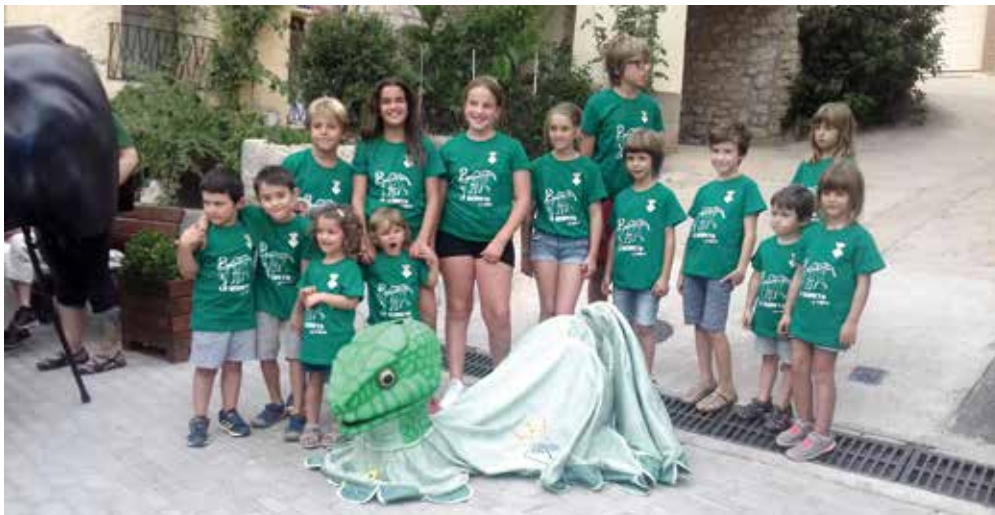
La canalla que van fer de portadors de la Serpeta, que va ballar per primera vegada acompanyada del Diable dels Avencs i la Dona d'Aigua.