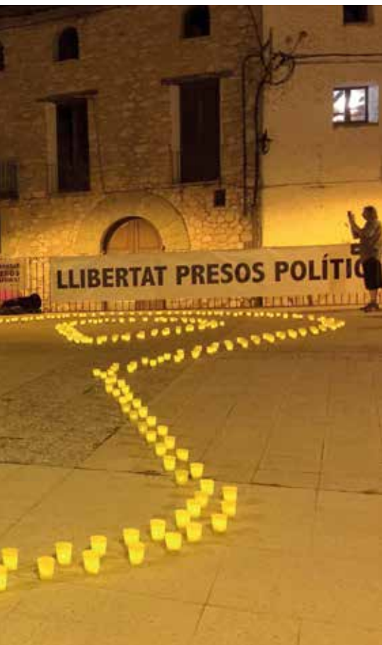
Organitzat pel CDR Muntanyes de Prades.