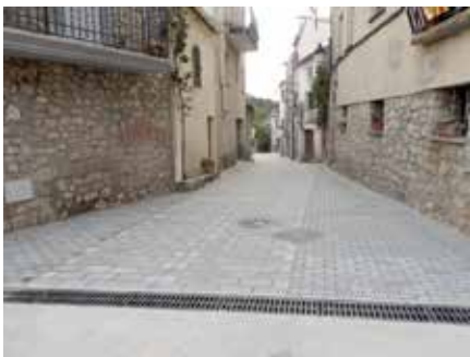
Aspecte de l'accés al local social i el carrer de la Canyada.