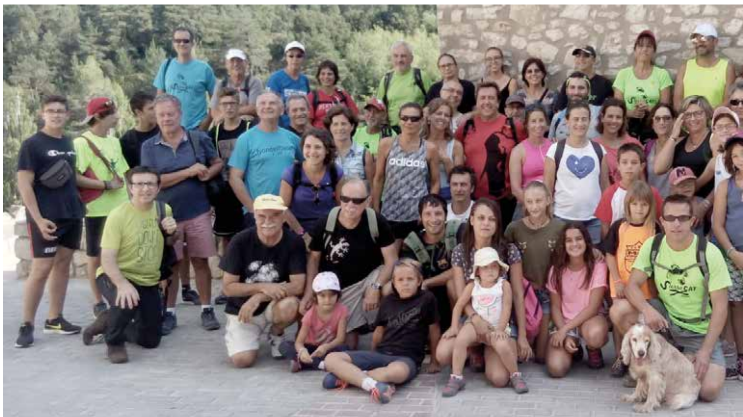
Participants en la sortida organitzada pels Birimbins de Prades, amb una ruta per la Febró fins a la cova de les Borres.