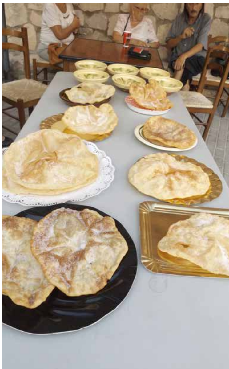
Orelletes elaborades pels veïns i veïnes del poble.