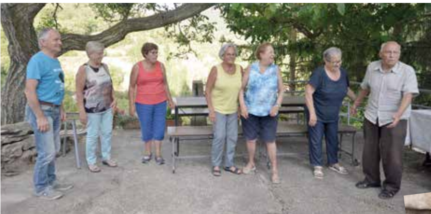
Durant una estona, els veïns i veïnes del poble que van viure els balls de Festa Major van estar recordant històries i anècdotes viscudes. A la dreta, dues toies.