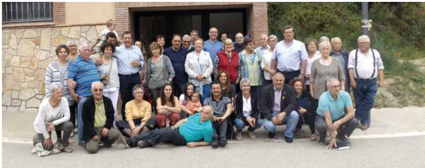
L'anterior Consistori i el nou, amb familiars i amics, després de l'acte del relleu a l'alcaldia.