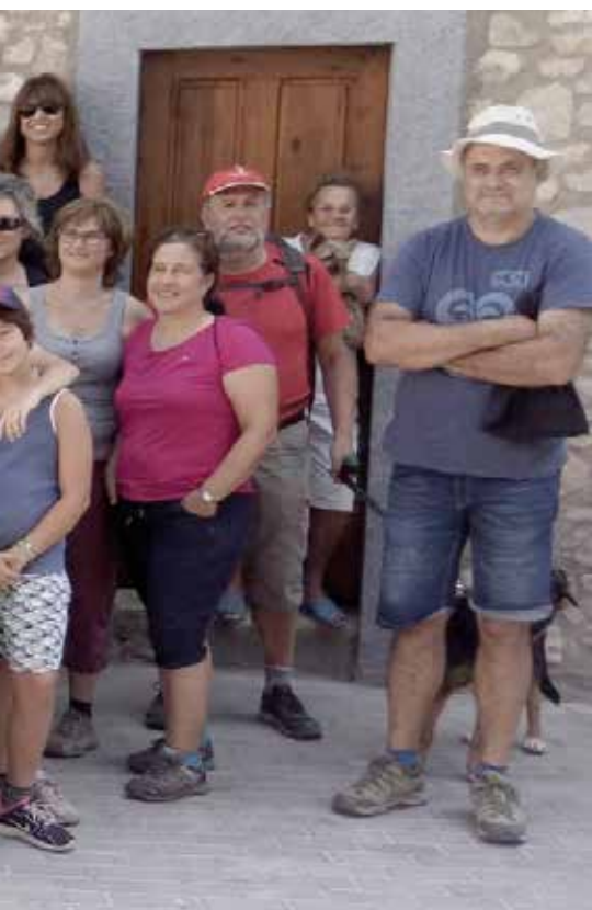
AJUNTAMENT DE LA FEBRÓ