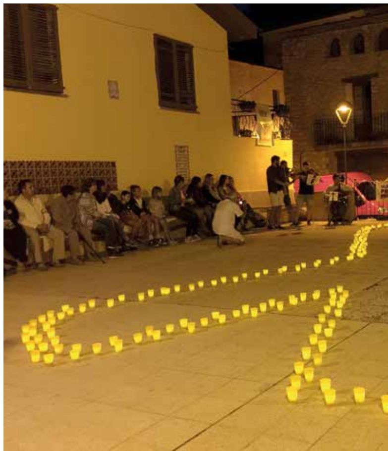
El cartell que va presidir la façana de l'antic ajuntament durant la Festa Major, i l'acte de reconeixement als presos polítics al Mirador de l'Hostal, orga