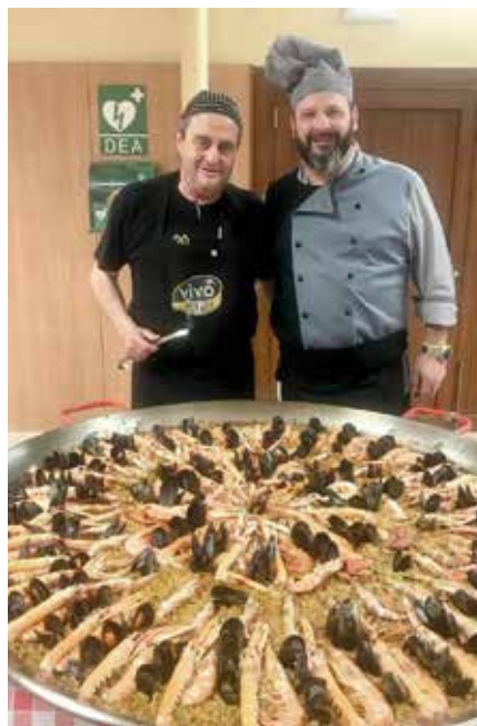
La retirada del pi, el 2 de juny, va ser l'excusa per fer un bon àpat.