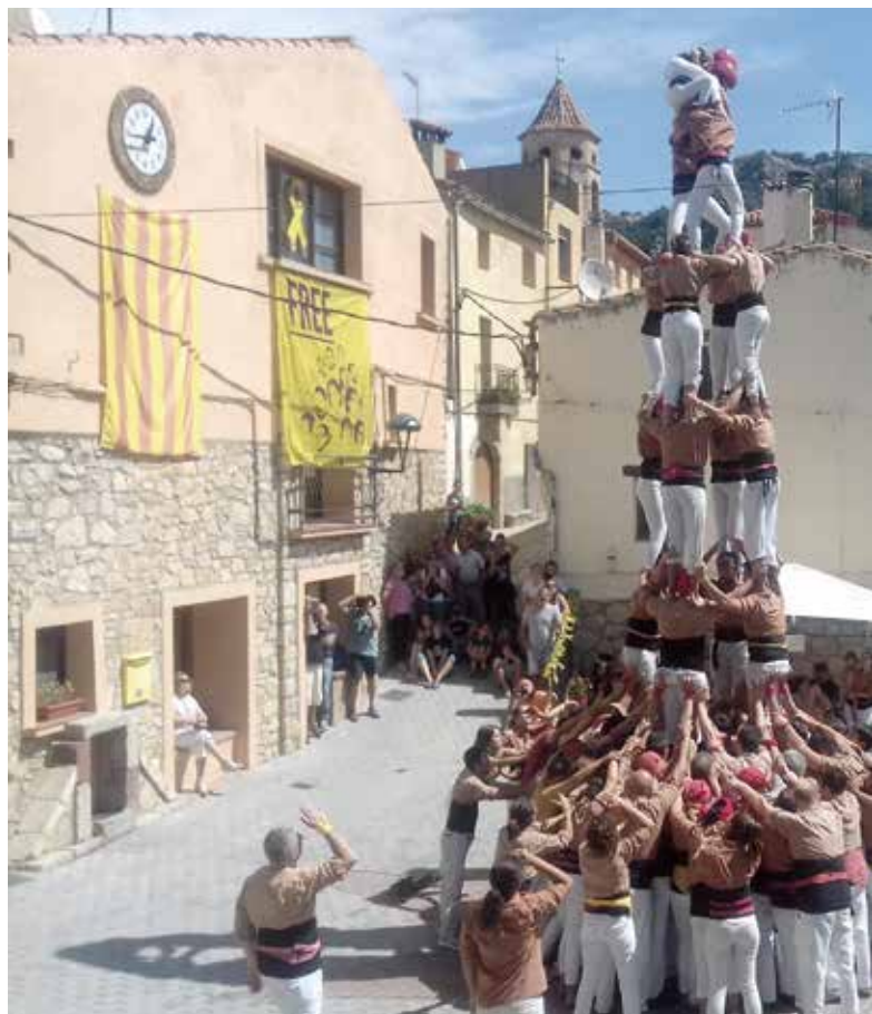
3de7 i 4de7 dels Xiquets de Reus, durant la seva actuació a la Festa Major de la Febró.