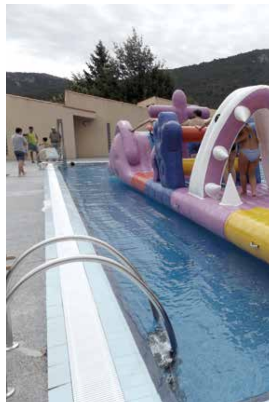
La Piscina Municipal va acollir diversos inflables aquàtics que van atraure tota la canalla del poble en una jornada lúdica.