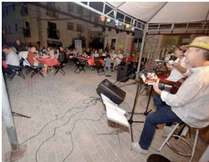
Degustació de vins de Mas d'en Baiget i actuació dels músics, que van interpretar cançons de taverna.